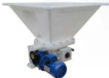
多种干投机型号，多种料斗材料可选